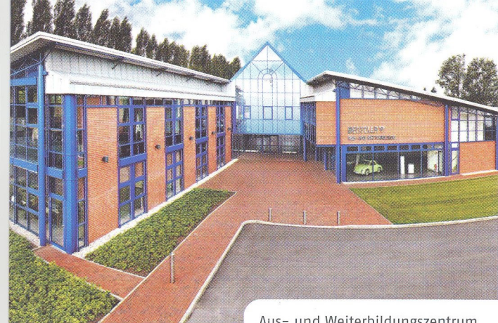
Aus- und Weiterbildungszentrum

KOMBINATIONSTUDIUM • Accounting and Finance