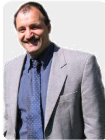
Professur für Wirtschafts- pädagogik, insb. Mediendidaktik und Weiterbildung