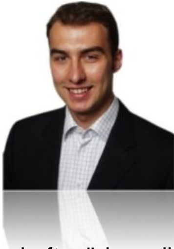
Wirtschaftspädagogik im Bachelor: